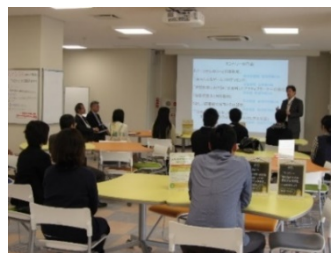
過去の表彰式の様子