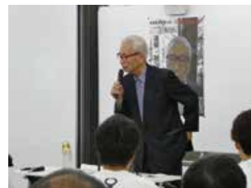
武村正義氏の講演のようす

平成 28 年 7 月から選挙権が 18 歳に引き下げられたことを受けて、1、2 年生を対象に投票への呼びかけをかねて、元内閣官房長官の武村正義氏をお招きして、投票の意味、投票の心構え、現代日本の政治状況、国際政治の動向について、くわしく語っていただきました。参加した学生は 21 名で、講演後には、学生たちから数多くの質問があり、武村氏はそのひとつひとつに丁寧に答えられていました。