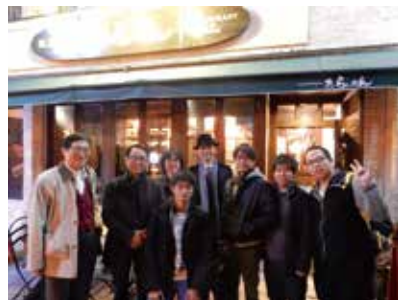
レクチャー後の夕食会が終わり、店の前で記念撮影。