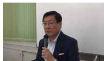
教養教育について熱く語る森脇学長

「教養講演会」の記念すべき第 1 回目は、森脇久隆学長をお招きし、教養教育がいかに大事かについて語っていただきました。森脇学長はすでに入学式で新入生に向け、教養教育についてのメッセージを送られていますが、今回あらためてテーマを教養教育にしぼり、しかも参加者の学生たちと非常に近い距離でお話をいただくことができました。この講演会は、eplus という学生有志のグループとの共催という形をとりましたので、森脇学長のお話を伺ったあと、参加した 25 名の学生たちとの活発な意見交換が行われました。