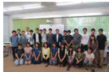
講演後の学生たちとの記念撮影