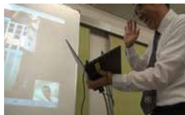
講演中、台湾の学校とスカイプで話す