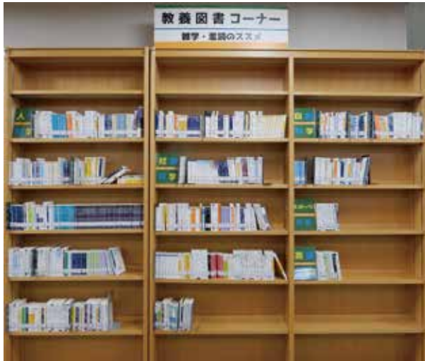
「雑学・濫読のススメ」と題した「教養図書コーナー」の書棚。分野別、著者別に分類されています。まだ書棚にアキがありますが、徐々に充実させて行く予定です。

岐阜大学の7項目ある「学生憲章」のいちばん最初に「本をたくさん読み、学んでいく上での土壌を作ろう。」と書かれているのをご存知でしょうか。自分の専門分野の本だけでなく、広くさまざまな分野の本を、若い時にたくさん読むことは、社会に出てからもきっと役に立つことと思います。そこで平成28年度の後学期から、図書館2Fの南側の書架に「教養図書コーナー」を設置しました。ここには、人文科学、社会科学、自然科学、語学、スポーツ・健康の各分野から、読みやすく分かりやすい入門書をはじめ、マンガで読める哲学や文学のシリーズ、自然科学の初心者向けのシリーズなどを中心に本を集めてみました。今後も、この教養図書の蔵書を少しずつ増やして、充実させて行く予定です。まずは、図書館の2Fの「教養図書コーナー」の前に立って、本棚を眺め、面白そうなタイトルの本があれば、ぜひ手にとってみて下さい。