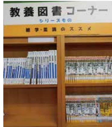
「マンガで読破シリーズ」、very short introductions シリーズ、「今日からモノ知り」(トコトンやさしい) シリーズ、「基礎シリーズ」を全巻、取り揃えています。ほかのシリーズものも、順次、加えて行きます。